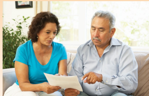
MAMUHAY NG MAAYOS SAN DIEGO

Ang mga serbisyo ng espesyalidad ng mental na kalusugan ay ibinibigay sa pamamagitan ng County of San Diego Mental Health Plan, na hiwalay mula sa iyong pangangalaga sa pisikal na kalusugan. Ang Mental Health Plan ay taos sa pagbibigay ng kalidad sa mga serbisyong sa mental na kalusugan sa mga karapat-dapat na mga adulto, at mga bata na nakakaranas ng malubhang at patuloy na mga problema sa mental na kalusugan. Ang mga serbisyo ng Mental na kalusugan ay kumpidensyal at base sa paniniwala na kaya at maaring mapagamot ang tao mula sa sakit sa pag-iisip. Kahit na ang paghingi ng tulong sa mga problema ng mental na kalusugan ay maaaring maging balakid, ang tulong ay nasa pagitan ng isang pagtawag lamang.