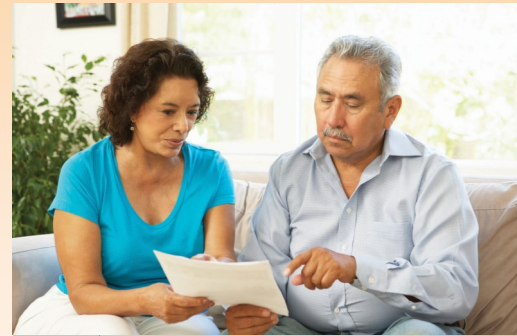
عش سعيداً في سان دييجو

مشاكل الصحة العقلية الخطيرة والمستمرة. خدمات الصحة العقلية محاطة بالسرية وهي تستند على الاعتقاد بأن في إمكان الناس الشفاء من المرض العقلي وهم يشفون منه. على الرغم من أن طلب المساعدة لحل مشاكل الصحة العقلية يمكن أن تشكل تحدياً، فإن المساعدة على بعد مكالمه هاتفية.