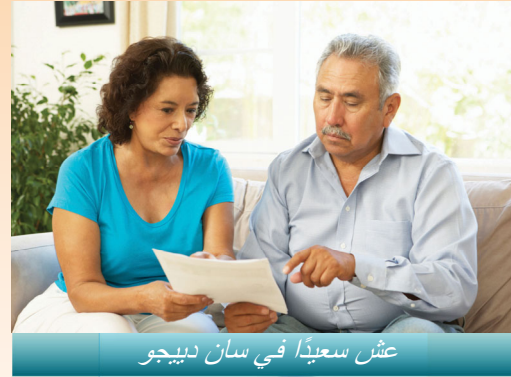
عش سعيداً في سان دييغو

مشاكل الصحة العقلية الخطيرة والمستمرة. خدمات الصحة العقلية محاطة بالسرية وهي تستند على الاعتقاد بأن في إمكان الناس الشفاء من المرض العقلي وهم يشفون منه. على الرغم من أن طلب المساعدة لحل مشاكل الصحة العقلية يمكن أن تشكل تحدياً، فإن المساعدة على بعد مكالمة هاتفية.