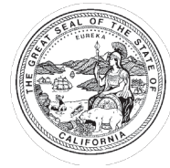
간행물 325 (12/16)

보다 자세한 정보를 원하신다면 담당 의사, 간호사, 사회복지사, 의료 서비스 제공자와 상담해주시고. 사전 의료 의향서는 변호사를 선임하여 작성하게 하거나 양식을 사용하여 본인이 사전 의료 의향서를 작성할 수 있습니다.