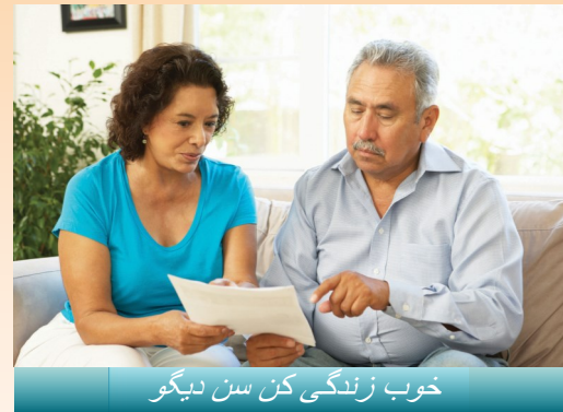
خوب زندگی کن سن دیگو

خدمات سلامت روان تخصصی از طریق طرح سلامت روان کانتی سن دیگو ارائه می شود، که جدا از مراقبت های سلامت جسمی شما است. طرح سلامت روان مسئول ارائه خدمات سلامت روانی با کیفیت برای بزرگسالان واجد شرایط، افراد مسن و کودکانی است که با مشکلات جدی و مزمن روانی مواجه هستند. خدمات سلامت روان محرمانه هستند و بر اساس این باور که مردم می توانند بیماری روانی خود را درمان کنند و درمان می کنند شکل گرفته اند. اگر چه درخواست کمک برای مشکلات سلامت روان ممکن است چالش برانگیز باشد، با این حال کمک تنها با یک تماس تلفنی انجام می شود.